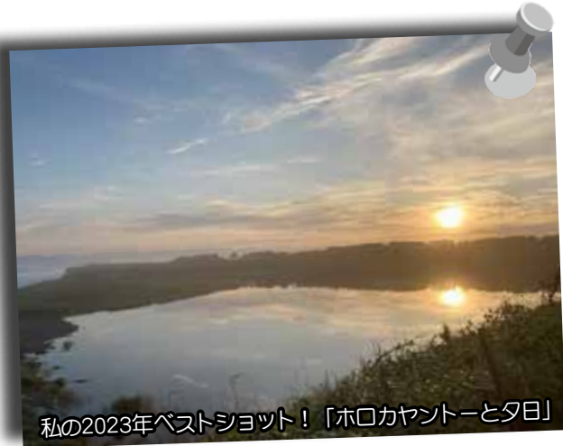
私の2023年ベストショット！「ホロカヤントーと夕日」