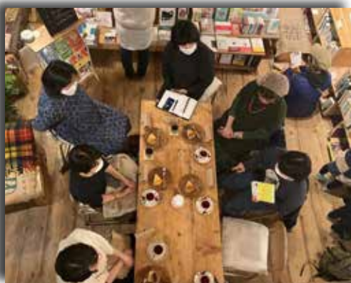
▲本と紅茶と甘いものは相性抜群

こともできました。釧路の読書会では、7冊四方の付箋に発表を聞いた感想やメッセージを書く時間を設け、各発表者に手渡しするという方法を用いていました。読書会は、ややもすると一方的な発表で終わってしまうことも多いのですが、こうすることでなんだか手紙をもらったような気分にもなり、聴き手とのコミュニケーションが生まれます。広尾の読書会では、毎月課題図書を定めて皆で同じ本を読み、感想を伝え合うということをしていました。同じ本でも感想や印象は人によって全く異なり、自分がすっかり読み飛ばしていた箇所にも深く言及する方もいて、とても面白かったです。