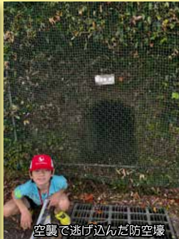
空襲で逃げ込んだ防空壕