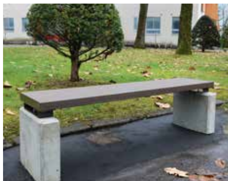
▲柏林公園のベンチが新しくなりました