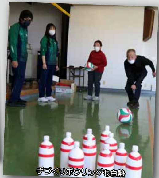
手づくりボウリングも自熱