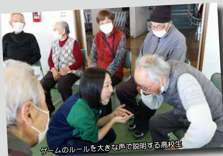
ゲームのルールを大きな声で説明する高校生

参加した皆さんは、「無理なく体を動かし、脳の活性にもなった。若い世代と触れ合うことができ楽しかった。また来てほしい。」と頬を緩めていました。