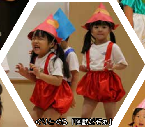
くりとくら「怪獣だぞお」