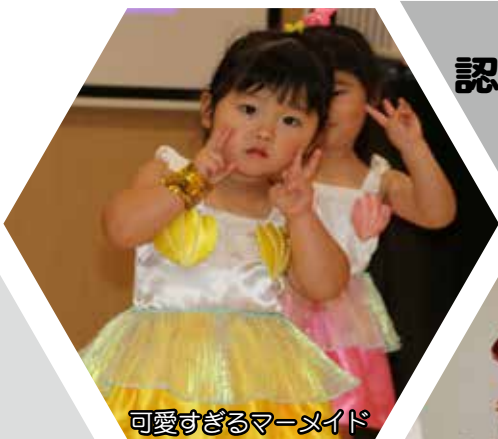
可愛すぎるマーメイド