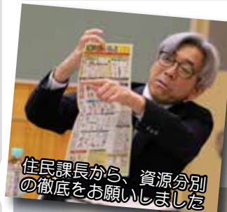
住民課長から、資源分別の徹底をお願いしました