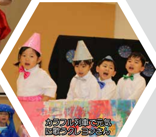
カラフル列車で元気に歌うクレヨンさん