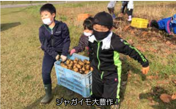
ジャガイモ大豊作！

令和3度から JA 青年部の皆様のご協力を得ながら、「あつまれ！ベンチャーキッズ！」という事業を実施しています。