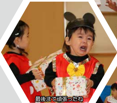
最後まで頑張ったね