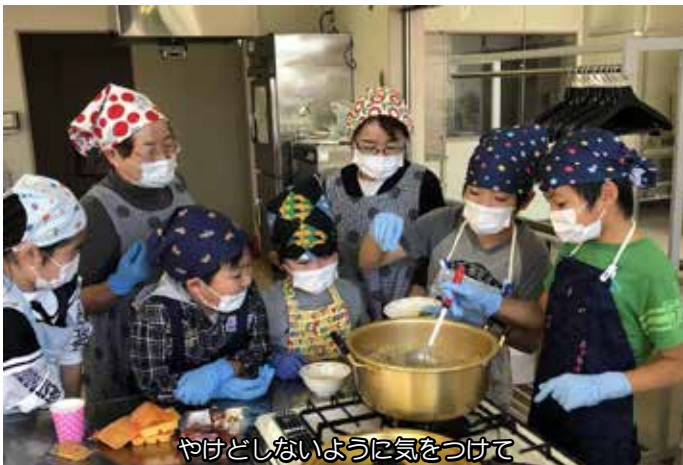
やけどしないように気をつけて