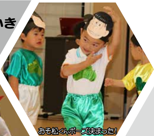
おそ松くんポーズ決まった!