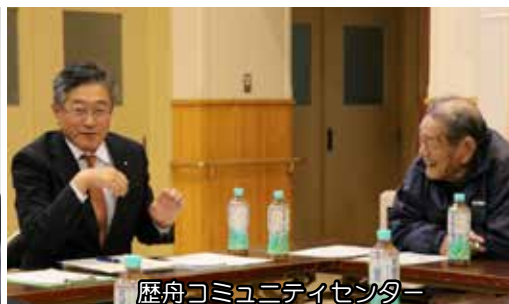
歴舟コミュニティセンター