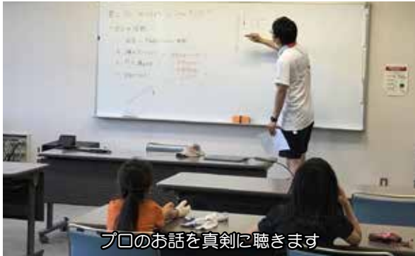
プロのお話を真剣に聴きます