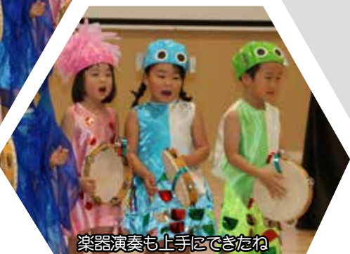
楽器演奏も上手にできたね