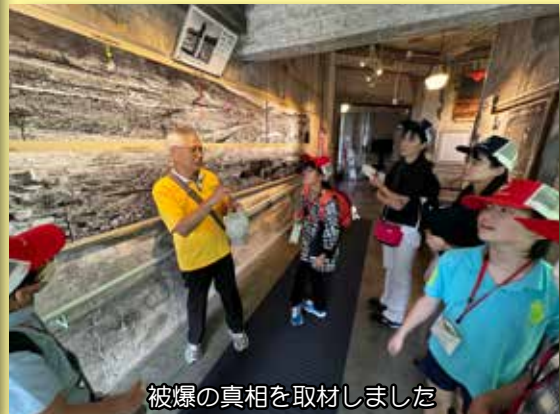
被爆の真相を取材しました