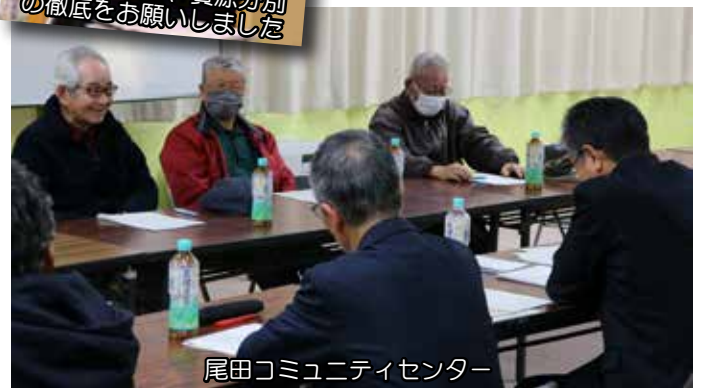
尾田コミュニティセンター

「もっとステキな道の駅計画」と題して 手書きの見取り図を持参された方もいらっしゃいました