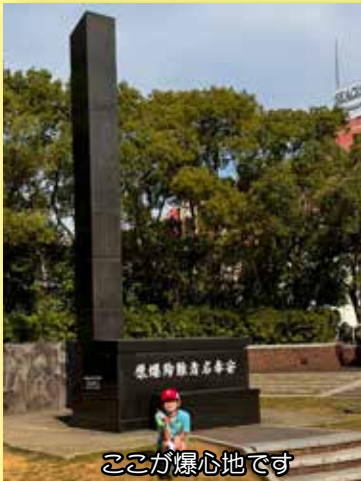
ここが爆心地です