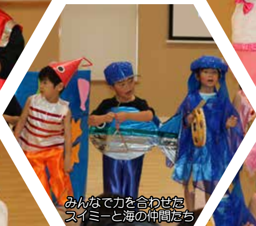
みんなで力を合わせたスイミーと海の仲間たち