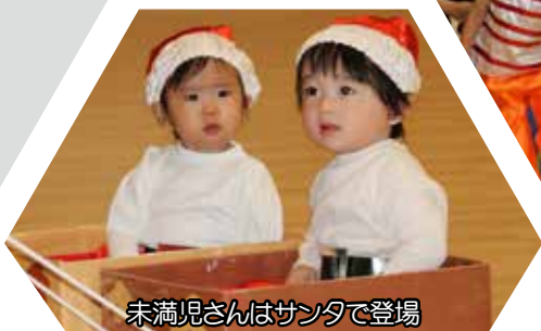
未満見さんはサンタで登場