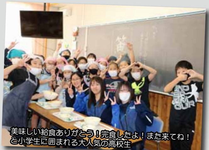
美味しい給食ありがとう！完食したよ！また来てね！ と小学生に囲まれる大人気の高校生