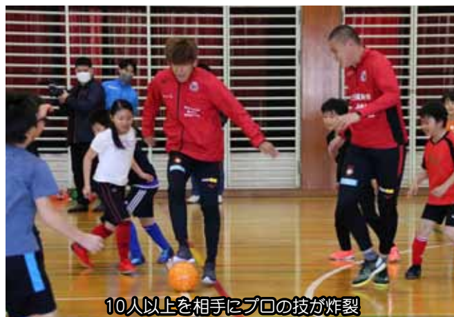
10人以上を相手にプロの技が炸裂

11月25日、B & G海洋センターに北海道コンサドーレ札幌の金子拓郎選手と中島大嘉選手、河合竜二リレーションズチームキャプテンが訪れ、サッカー少年団に指導を行いました。基礎練習の後に行われたコンサチーム3人VS学年ごとで対決したハンディ付きミニゲームでは、プロの素早い足技に圧倒されながらも果敢に攻め込み、ゴールを奪って歓喜に沸きました。