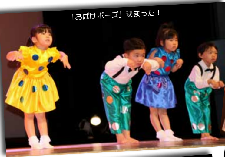
「おばけポーズ」決まった！