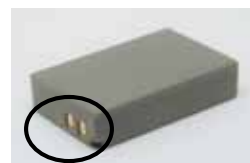
絶縁テープを貼る

絶縁していない状態の電極に金属や電池が触れると、ショートする場合があります。発火や破裂する危険性があります。電極やリード線を覆うように、テープなどで絶縁してください。