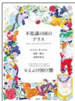
『不思議の国のアリス/鏡の国のアリス』