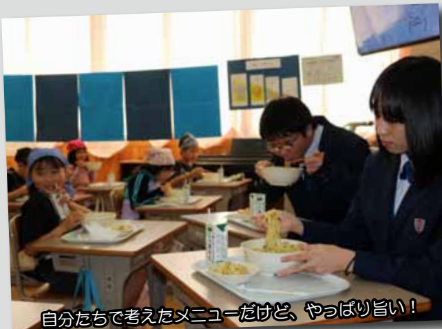
自分たちで考えたメニューだけど、やっぱり旨い！

当初はピリ辛味で試作した栄養満点の野菜たっぷりあんは、低学年でも食べられるように甘めに改良したそうです。誰にでも美味しく食べてもらえるように、クラス全員で意見を出し合って決めたメニューは、「思いやり給食」でもあり、素晴らしい学びの機会になったようです。