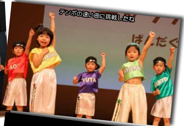
テンポの速い曲に挑戦したね