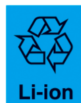
リチウムイオン電池