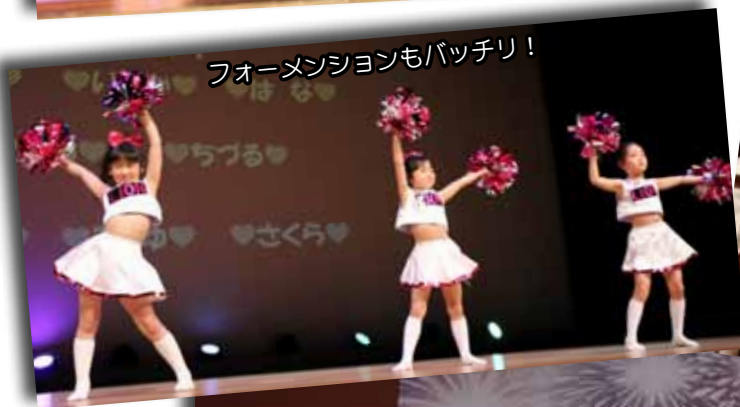
フォーメーションもバッチリ！