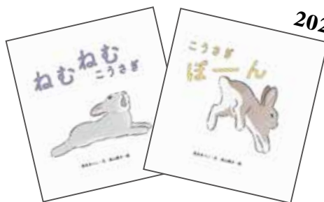
『ねむねむこうさぎ』 『こうさぎぼーん』