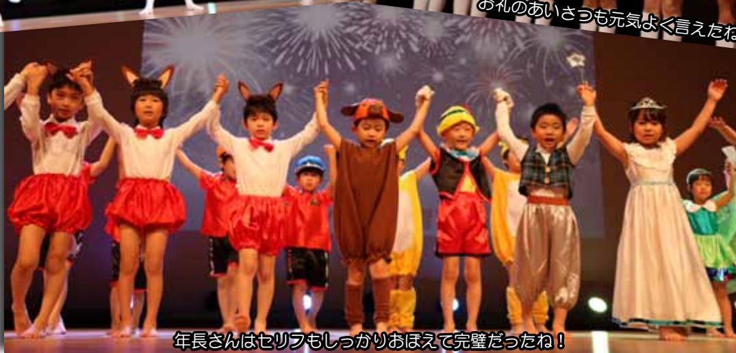
年長さんはセリフもしっかりおぼえて完璧だったね！