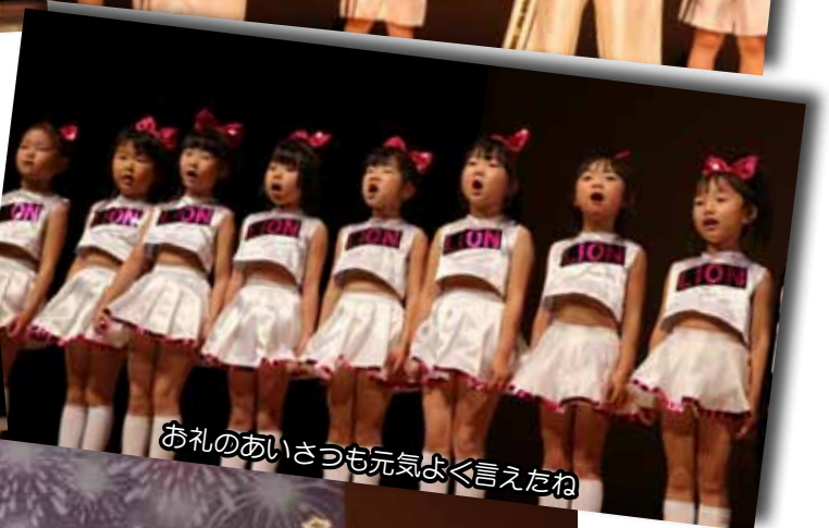
お礼のあいさつも元気よく言えたね