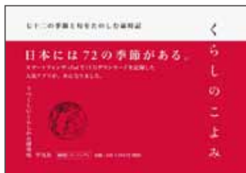
『くらしのこよみ 七十二の季節と句をたのしむ歳時記』