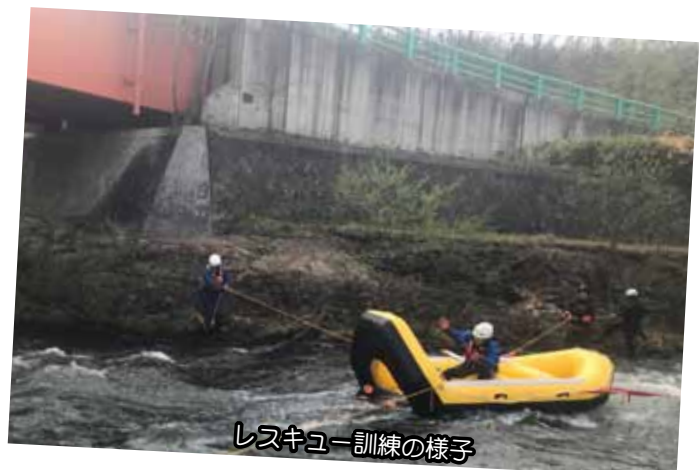
レスキュー訓練の様子