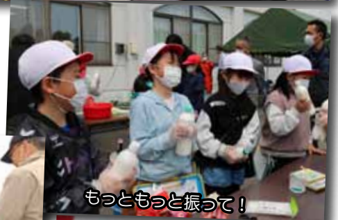
もつともつと振って！