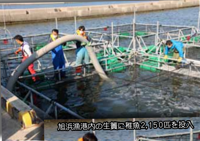
旭浜漁港内の生簀に稚魚2,150匹を投入

2度の試験を乗り越え、挑戦を続ける飼育試験が成功し、養殖事業が軌道に乗ることを切に願っています。