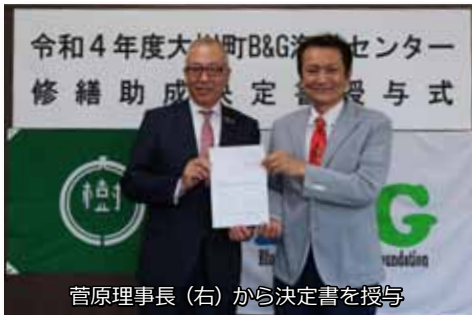
菅原理事長（右）から決定書を授与