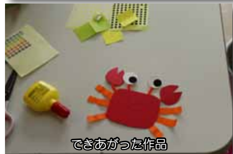
できあがった作品