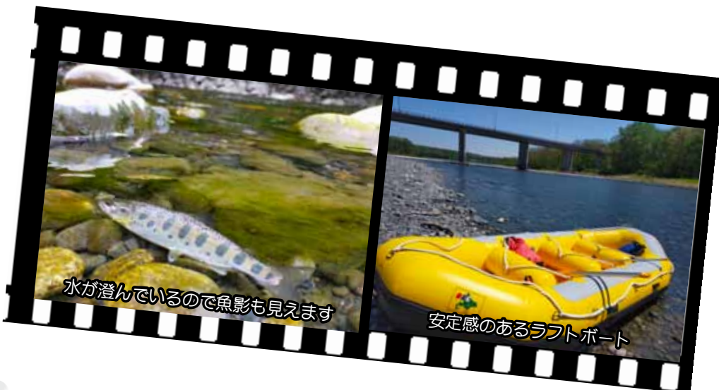
水が澄んでいるので魚影も見えます

不思議な事や疑問に思った事は 何でも調べると面白い発見があり ますよ。次回はどんな発見がある のか楽しみですよ。