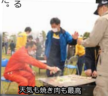
天気も焼き肉も最高