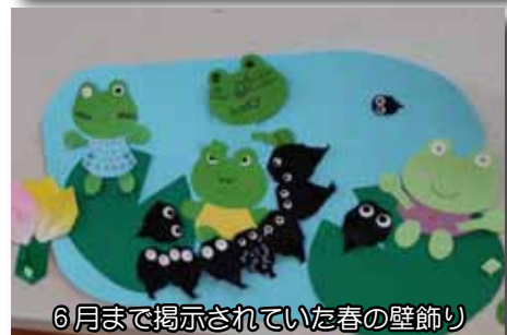
6月まで掲示されていた春の壁飾り