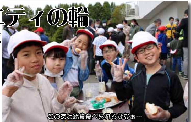
このあと給食食べられるかなあ...

5月19日、今年で46回を迎える中島地区酪農祭が開催されました。地域住民をはじめ、農業に携わる関係者が一同に会し、作業事故防止や百穀成就、畜産繁栄を祈願し、屋外バーベキューで交流しました。大樹小学校4年生も総合学習の一環として参加し、地域の方々と手作りバターに挑戦。できたてバターの美味しさに目を見開きながらパンをほおぼる姿に周りの人も自然と笑顔になりました。行政区の活動が長く皆さんに親しまれている理由がわかるお祭りでした。