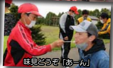
味見どうぞ「あーん」