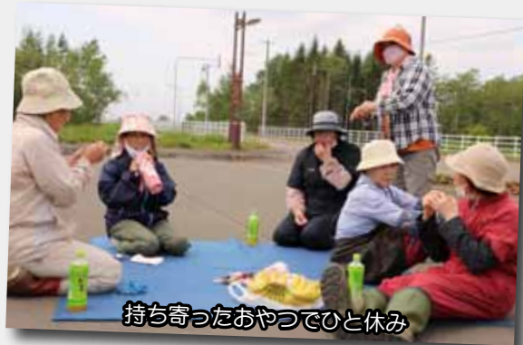
持ち寄ったおやつでひと休み

5月20日、個人ボランティアの皆さん7人に、ふるさと大橋と町立病院の花壇を整備していただきました。山菜採りの話題など世間話をしながら汗をふきふき、300を越える赤や黄色の苗をTAIKIの文字になるように手際よく植えていきました。作業終了後は花壇を見ながら「いいねー」と自画自賛する一言に皆さん大笑い。道行く自動車もスピードを緩めながら整備された花壇を眺めていました。