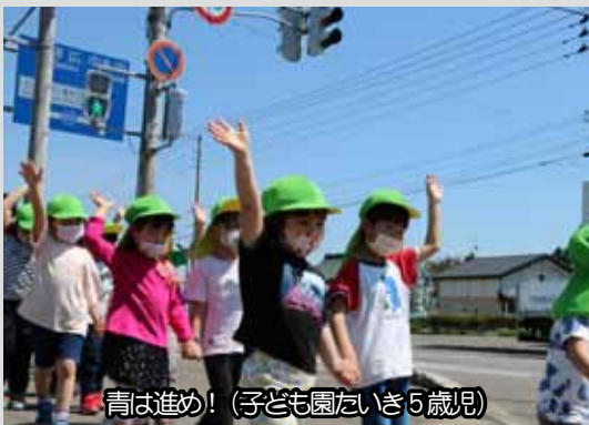
青は進め！（子ども園たいぎ5歳児）