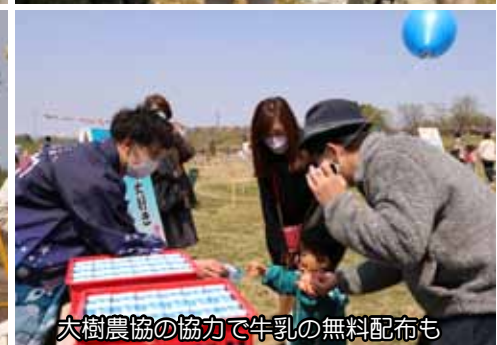
大樹農協の協力で牛乳の無料配布も