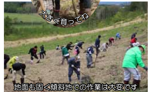
地面も回く傾斜地での作業は大変です