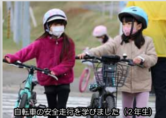
自転車の安全走行を学びました（2年生）