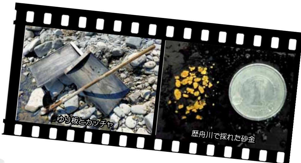
ゆり板とカッチャ

不思議な事や疑問に思った事は 何でも調べると面白い発見があり ますよ。次回はどんな発見がある のか楽しみですよ。