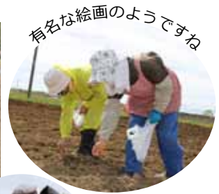
有名な絵画のようですね