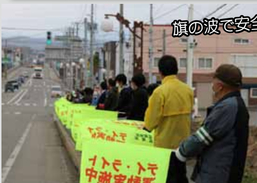
旗の波で安全運転を啓発