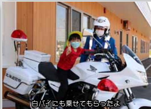
白バイにも乗せてもらったよ