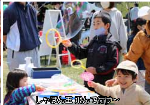
しゃぼん玉 飛んで行け～