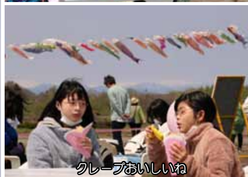
クレープおいしいね