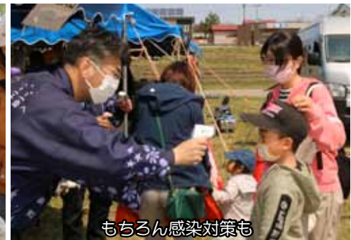
もちろん感染対策も