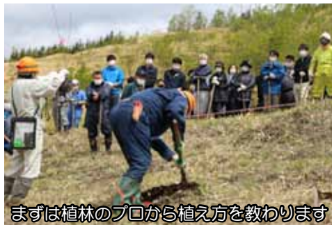
まずは植林のプロから植え方を教わります