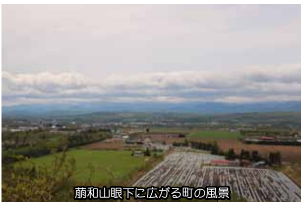
蕨和山眼下に広がる町の風景