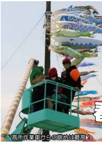
高所作業車からの眺めは最高！