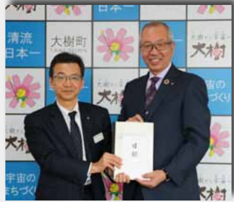
水戸部十勝総合振興局長（左）から酒森町長へ目録を贈呈（3月25日）

大樹町にお寄せいただいた50件、約170万円の寄附金は、大打撃を受けた秋サケ定置網漁やサクラマスの養殖事業など、漁業者の支援に有効活用します。