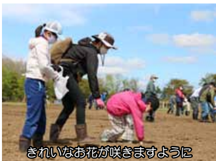
きれいなお花が咲きますように

使い慣れない鍬を振り下ろし、汗だくになりながら深さ30cm程度の穴を掘り、ひげ根までしっかり植え込みました。今年植えた苗木が育つまでには50年以上要します。私たちは日々の暮らしで自然の恩恵を受けています。きれいな水や空気を未来に残すため、豊かな山と海を守る『豊かな森』を一緒につくりましょう。来年も皆さんの参加をお待ちしています。