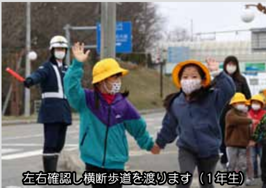
左右確認し横断歩道を渡ります（1年生）

町内での交通事故を未然に防ぐため、認定子ども園たいぎと小学校で交通安全教室を、町内各事業所や各種団体の方々のご協力を得て交通安全運動を行いました。