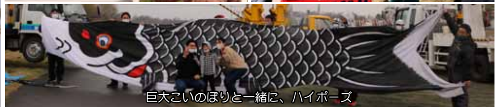
巨大こいのぼりと一緒に、ハイポーズ