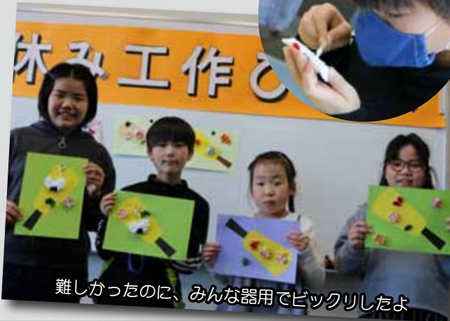
難しかったのに、みんな器用でビックリしたよ