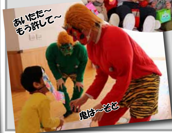
あいだた～もう許して～