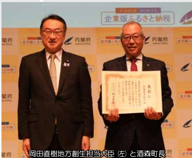
岡田直樹地方創生担当大臣（左）と酒森町長

大樹町は、引き続き北海道スペースポートを核とした「宇宙版シリコンバレー」創造を目指すべく取組を進めていきます。