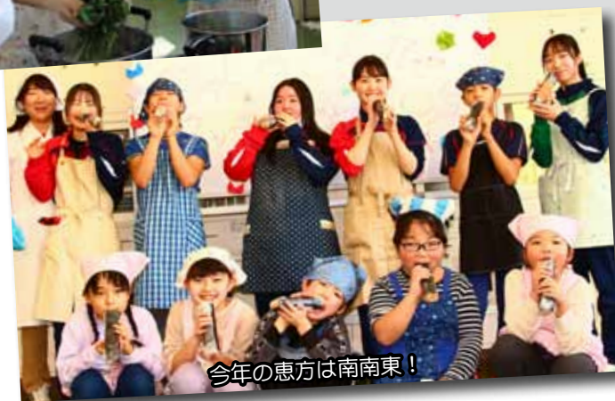
今年の恵方は南南東！