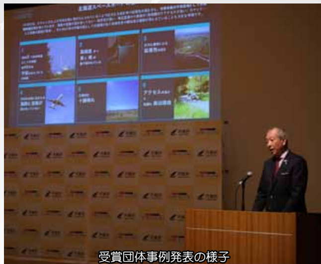
受賞団体事例発表の様子