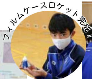
フィルムケースロケット完成!