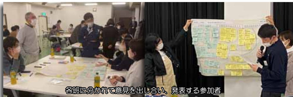
各班に分かれて意見を出し合い、発表する参加者

町章の由来のように、町民が互いに話し合い、円満な町づくりを進めて「大きな樹」に発展していきけるような計画づくりを目指します。