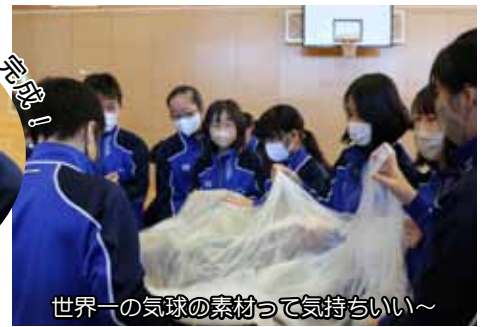
世界一の気球の素材って気持ちいい~