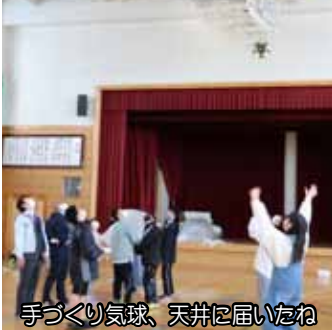
手づくり気球、天井に届いたね