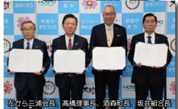
左から三浦会長、高橋理事長、酒森町長、坂井組合長