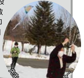
凧揚げ 孫のよう可愛い

お料理や陶芸、 たこあ 凧揚げなどを一緒に楽しみ、「孫のようで可愛い」「普段できないことをやさしく教えてくれる」と互いに好印象を持ちながら笑顔の時間を過ごしました。