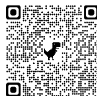
▲調査結果はこちら