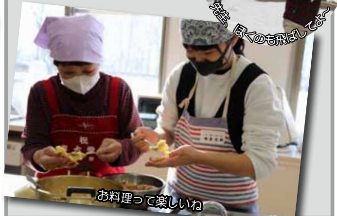
お料理って楽しいね