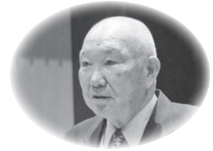
すが としのり 議員