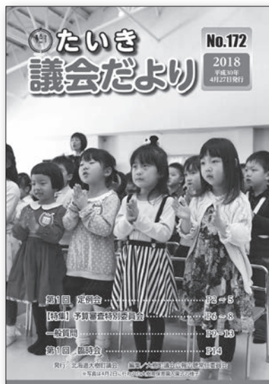
これまでのレイアウトを一新し、現在の2色刷りへと変更 (平成30年4月)