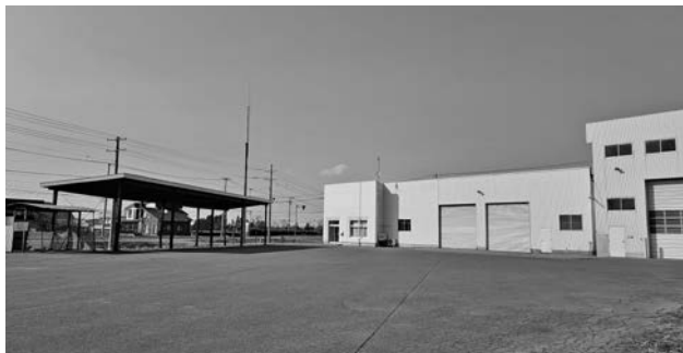
交換により取得したヤンマーアグリジャパン株式会社跡地

審議し、原案可決しました。このページでは、委員会での質疑と答弁の一部を掲載しています。