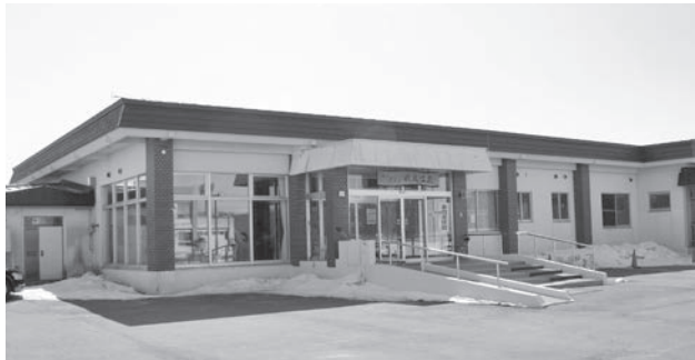
改修工事が完了した晩成温泉