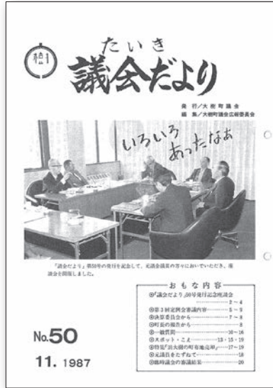
50号発刊記念として元議員による座談会を掲載 (昭和62年11月)