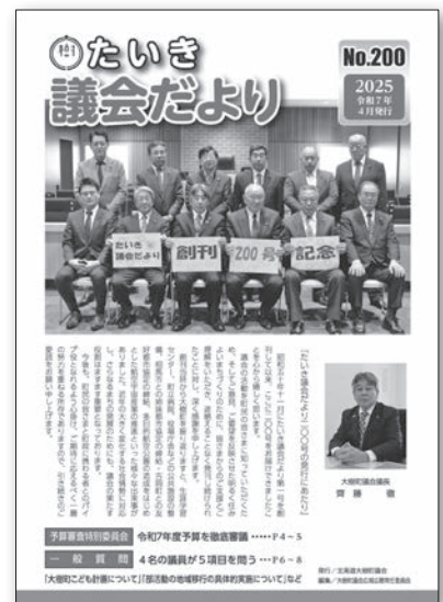
200号発刊記念として議長の挨拶・記念ページを掲載 (令和7年4月)