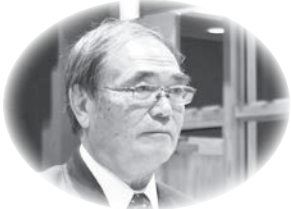
したみ かずよし 議員 和義 志民

答 (沼田教育長) そういった声もあるということも踏まえながら、検討していきたい。