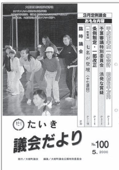
100号発刊記念として議長・広報委員長の挨拶を掲載 (平成12年5月)