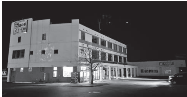
道の駅コスモール大樹の駐車場