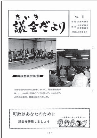
当時は白黒で、大きさも少し小さいB5サイズでした (昭和50年11月)