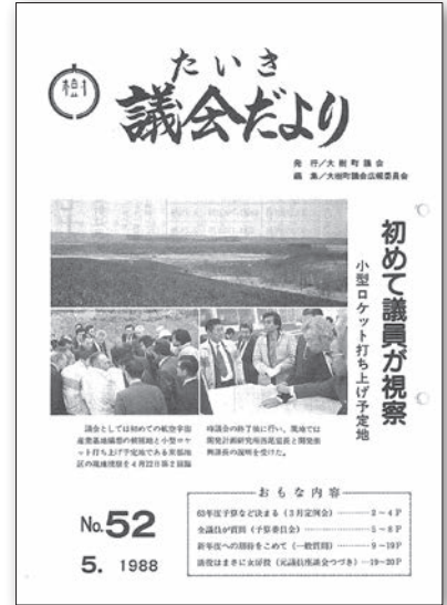
多目的航空公園建設にあたり建設予定地を視察 (昭和63年5月)