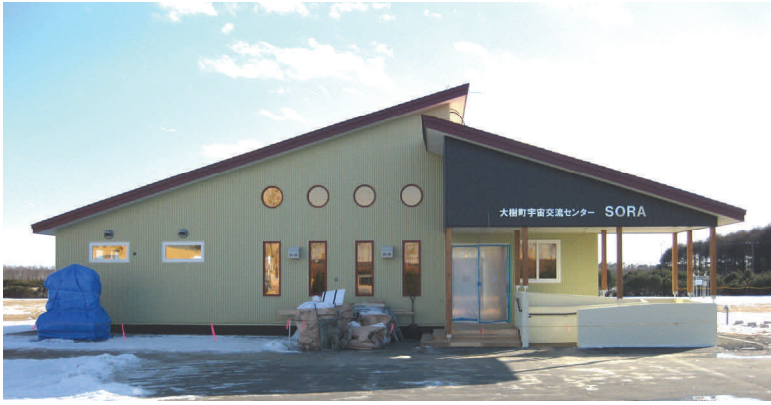
概ね出来上がった「SORA」の外観。残すは内装など。

町では、多目的航空公園の町格納庫近くに、展示スペースと集会スペースを兼ねた大樹町宇宙交流センター「SORA」（仮称）を建設しており、4月には開館する予定です。この施設は、大樹町で行われている航空宇宙に関する各種実験や取組み等を知っていただくために、北海道の交付金を活用し、整備するものです。開館期間/時間（未定）中は基本的に誰でも見学可能（入場無料）の予定で、町内外皆様の来館を見込んでおります。施設の愛称「SORA」は、航「空」と宇「宙」の字の読み方から取りました。多くの皆様のご来館をお待ちしております！