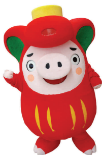
共和国PRキャラクター 「おおふなトン」

その後、放球する気球の大型化により実験場が手狭になったことから、2007年に閉所され、大樹町の多目的航空公園に大気球実験が移転し、現在に至っています。