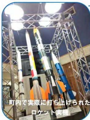
町内で実際に打ち上げられたロケット実機