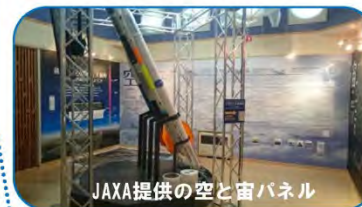
JAXA提供の空と宙パネル