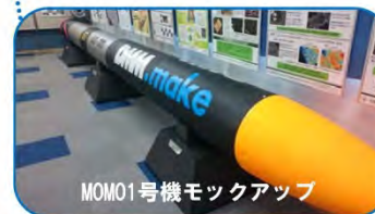
MOMO1号機モックアップ

MOMO1号機のモックアップや過去の燃焼実験で実際に使用したロケットエンジン、姿勢制御実験機「LEAP4」機体(胴体部)などをご紹介します。