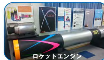
ロケットエンジン