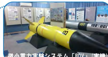
微小重力実験システム「BOV」(実機)