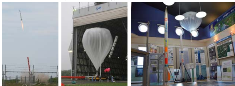
CAMUI型ロケット 大気球実験 大樹町宇宙交流センターSORA

また、平成26年に航空宇宙関連の展示施設「大樹町宇宙交流センターSORA」がオープンしました。SORAには、当町で打上げを行った小型ロケット3機をはじめ、実験の様子を視聴できる映像システムなどが約50点を展示しています。入場は無料ですので、是非お立ち寄りください。