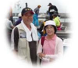
千葉県から体験移住のSさん夫妻

大樹町には山・川・海の3拍子が揃っています。山は日高山脈、川は日本一の清流・歴舟川、海は太平洋に望んでいます。私は山菜取りと釣りが趣味なので大樹町はうってつけです。春はフキノトウから始まり、コゴミ・タラの芽・ウド・ワラビなどがたくさん採れます。釣りは、川では溪流釣り、海ではシーズンごとに多種多様な魚を釣ることができます。特に秋の鮭釣りは最高で、投げ釣り、船釣りができます。農産物は、産直の販売所で新鮮で安く、安全でおいしい野菜を買うことができます。千葉に比べると旬のものが半分以下の値段で買うことができます。夏から秋の枝豆やトウモロコシ、地元産の牛乳から作ったチーズも大変美味しいです。