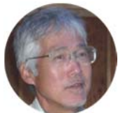
岐阜県から移住されたYさん

山や海といった雄大な大自然に魅せられ、大樹町での体験生活を経て、移住を決断されたYさん。体験生活中は、地域の方々から野菜をもらったりと、人と人との繋がり、そして人情を感じることができ、それが移住決断への後押しとなりました。