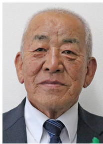
西山 弘志議員 〈2期目〉

町民の声を町政に届け、高齢者が安心して暮らせる豊かな町づくり、町営合葬の推進、自然災害に強い町づくり、活力と魅力ある町づくりなどに取り組みます。