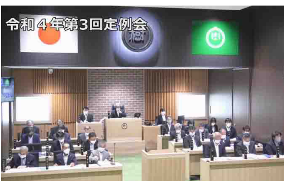
令和4年第3回定例会